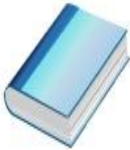
एकम् पुस्तकम् ।