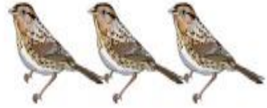
त्रयः चटकाः ।