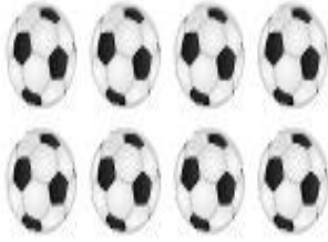
अष्ट कन्दुकानि ।